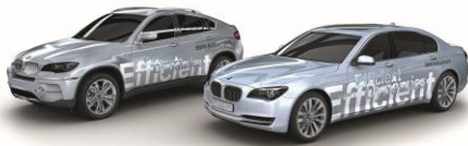
BMW Group AG und 7er Series Accelerator BMW ConnectedDrive und 7er Series Accelerator © BMW AG Stuttgart, Bereich Unternehmensentwicklung Nur für Personalverleiher / Projektmanagementsysteme 01/2009

Ein Beispiel aus dem Bereich Automotive ist der Einsatz von PPMS bei der Erprobung von Fahrzeugen durch die BMW-Hauptabteilungen „Versuch Gesamtfahrzeug“ und „Crash“. Das System kommt somit auch bei der Erprobung des neuen 7er BMW zum Einsatz. Es erlaubt eine effiziente und übersichtliche Planung der Ressourcen und zugleich eine saubere Dokumentation von Projekten.