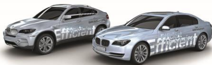
BMW Group AG und 7er Series Accelerator BMW ConnectedDrive 7er Series Accelerator Projekt PPMS Nur für Personalwahl / Personalplanung © BMW AG 01/2008

Ein Beispiel aus dem Bereich Automotive ist der Einsatz von PPMS bei der Erprobung von Fahrzeugen durch die BMW-Hauptabteilungen „Versuch Gesamtfahrzeug“ und „Crash“. Das System kommt somit auch bei der Erprobung des neuen 7er BMW zum Einsatz. Es erlaubt eine effiziente und übersichtliche Planung der Ressourcen und zugleich eine saubere Dokumentation von Projekten.